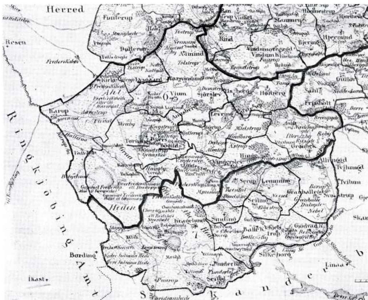
Lyngby-Hids Herreders retskreds som den så ud efter reformen i 1687