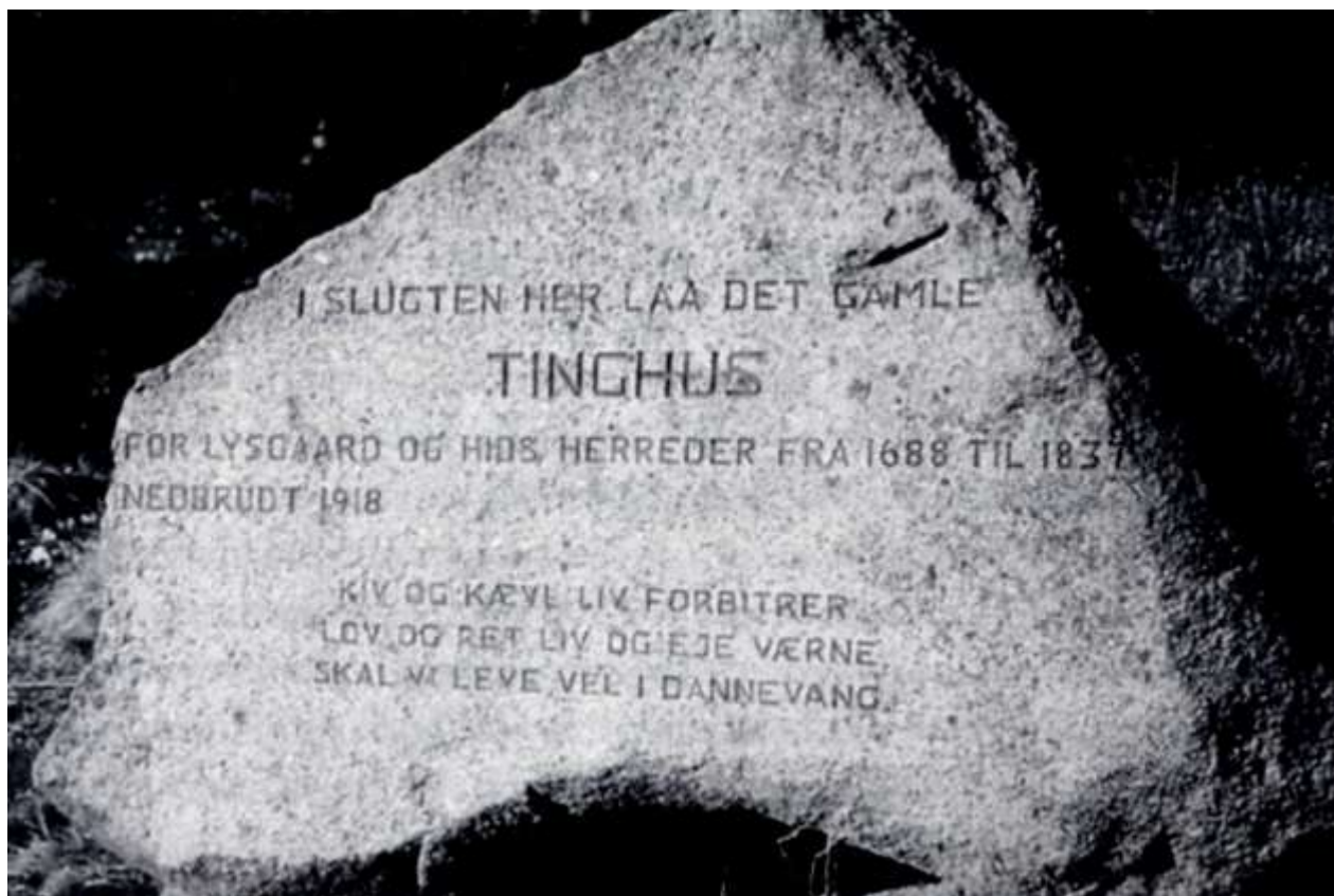
I dag markerer denne sten, hvor det gamle tinghus lå